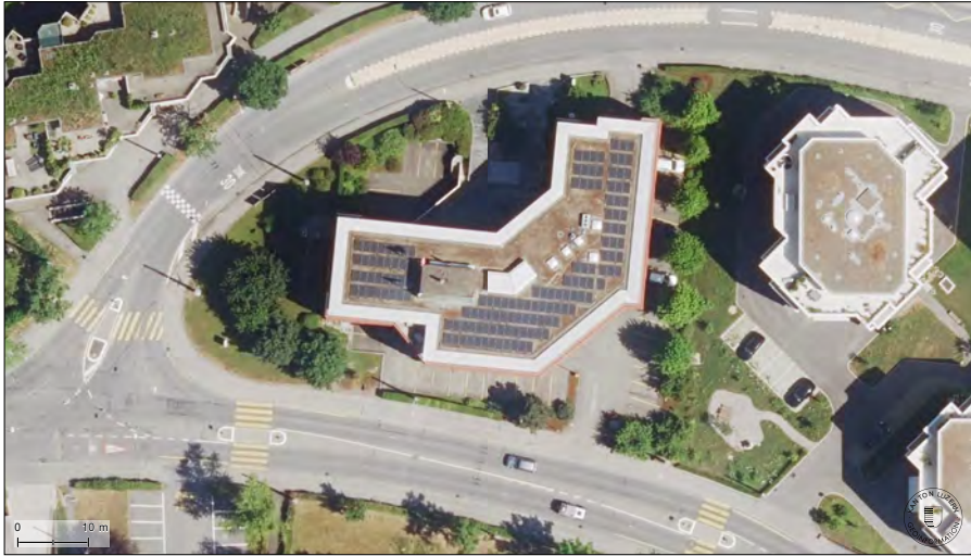
Luftansicht des neuen Standortes für das Kantonsgericht. In der Mitte das bestehende Gebäude an der Würzenbachstrasse 8 in Luzern.