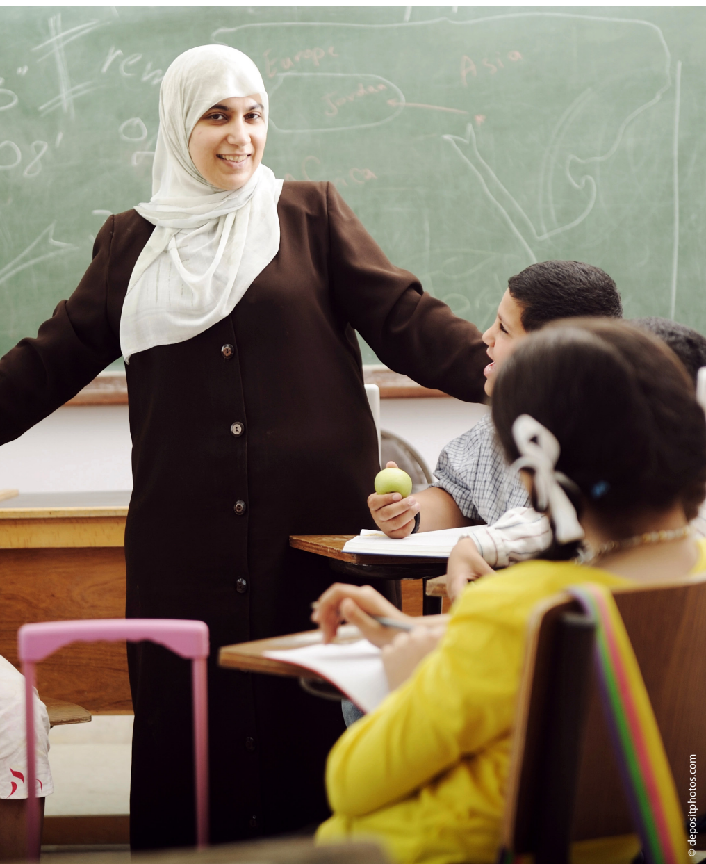
Eine Lehrerin mit religiösem Symbol im Klassenzimmer. Der Umgang mit sichtbaren Glaubenszeichen an der Volksschule wirft in Luzern Fragen auf.

Unsere staatliche Ordnung beruht auf Gleichberechtigung, kultureller Kontinuität und der Trennung von Staat und Religion. Diese Balance darf nicht einseitig verschoben werden. Wer christliche Werte aus dem Schulalltag verdrängt, schwächt den gesellschaftlichen Zusammenhalt. Die Schule braucht klare, kantonale verbindliche Regeln. Neutralität bedeutet Gleichbehandlung, nicht das Zurückdrängen der eigenen kulturellen Identität. ●