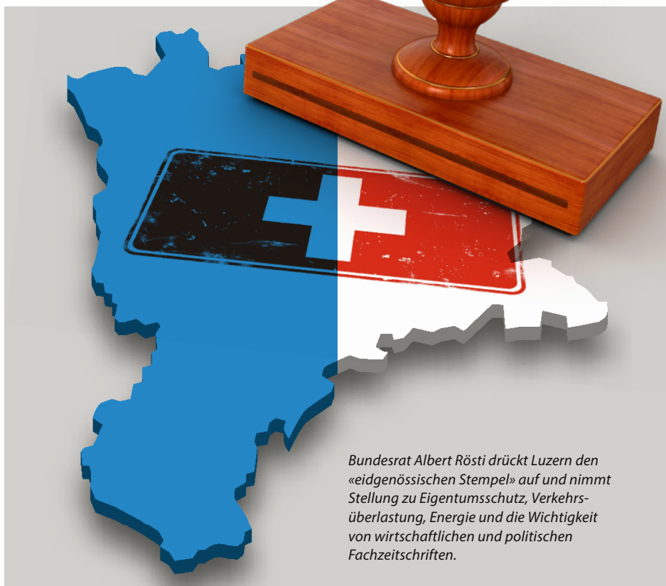
Bundesrat Albert Rösti drückt Luzern den «eidgenössischen Stempel» auf und nimmt Stellung zu Eigentumsschutz, Verkehrsüberlastung, Energie und die Wichtigkeit von wirtschaftlichen und politischen Fachzeitschriften.

Im Energiebereich produziert der Kanton Luzern im Sommer oft mehr Solarstrom, als er verbrauchen kann. Gefragt sind Lö-